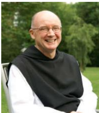
Dom Eamon Fitzgerald Generální opat

Jednou z věcí, které si na tomto programu zvláště cením, je způsob, jakým spatřil světlo světa. Já sám jsem byl zainteresovaným divákem a svědkem jeho zrodu, a to počínaje Generální kapitulou v roce 2014. Pro mě doslova a do písmene vyjadřuje evangelijní podobenství o hořčičném zru.