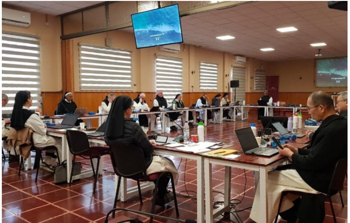
Réunion de la Commission centrale, Chili