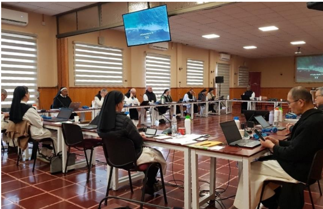
Reunión de la Comisión Central, Chile

Cursos y programas que pueden ser de interés, p.4