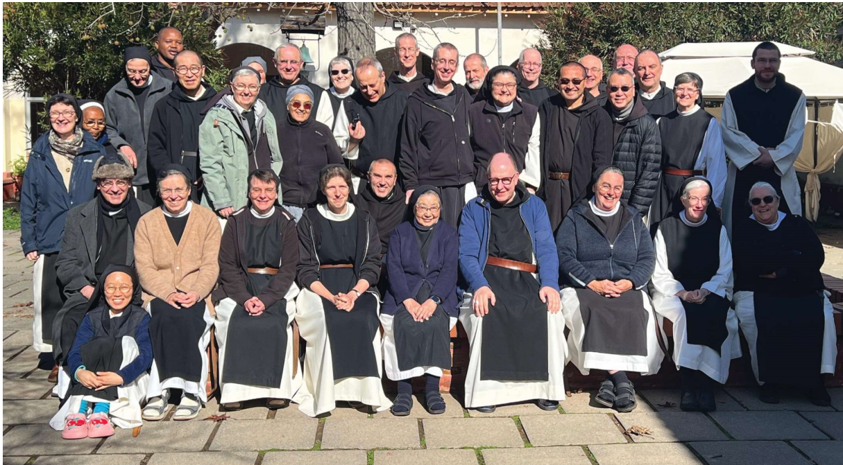
De Centrale Commissie, Chili 2024