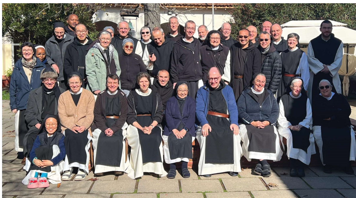
The Central Commission, Chile 2024