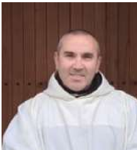
D. Jesus (Paraíso)